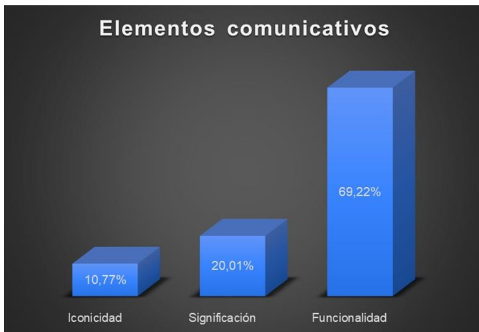
Gráfica Nº 3. Elementos comunicativos.

Con el análisis de datos de la tercera encuesta la Gráfica Nº 3., resalta fuertemente que el 69,22% de los encuestados se decantaron por la funcionalidad, demostrando que se prefiere que las imágenes cumplan con su cometido por encima de todo. Con un 20% de selección, la significación que es la capacidad de una imagen para dar su mensaje de forma clara, permitiendo que los conocimientos vean sus definiciones reflejadas. Por último, el 10% de participantes se seleccionó la Iconicidad, siendo la capacidad de representar un mensaje por medio de una imagen específica, conectando el lenguaje visual con las ideas que respaldan a la percepción.