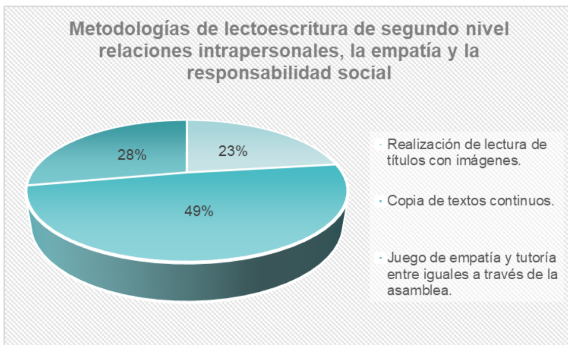
Gráfica N° 2. Metodologías de lectoescritura de segundo nivel relaciones intrapersonales, la empatía y la responsabilidad social.

La Gráfica N° 2., representa los resultados en la dimensión metodologías de lectoescritura de segundo nivel relaciones intrapersonales, la empatía y la responsabilidad social de la siguiente manera: “Realización de lectura de títulos con imágenes” con el 23%, la “Copia de textos continuos” con el 49% y el “Juego de empatía y tutoría entre iguales a través de la asamblea” con el 28%.